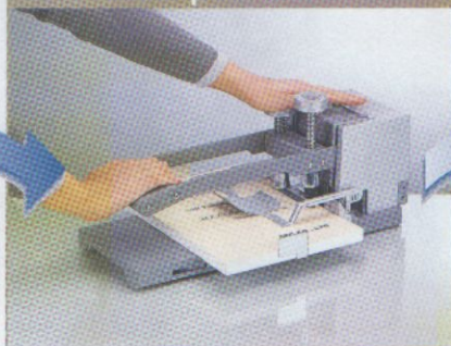
5. Presser pour assembler