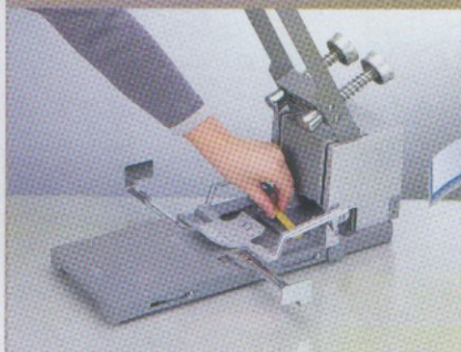
1. Placer la lamelle