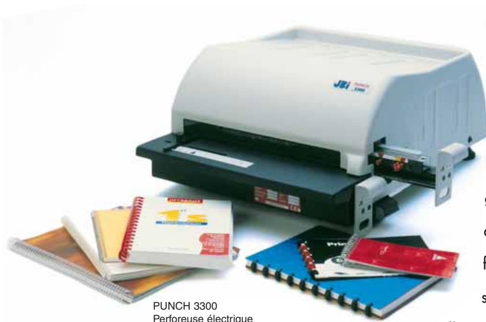
PUNCH 3300 Perforeuse électrique

La Perforeuse électrique PUNCH 3300 est une machine professionnelle fiable, robuste, ergonomique et d'une grande facilité d'utilisation destinée principalement à la finition de documents de formats standards (jusqu'à 330mm).